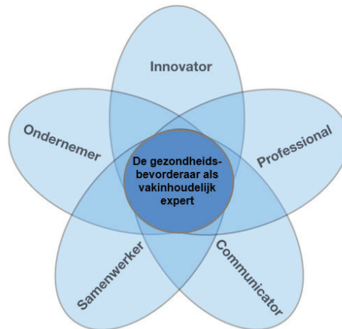
Figuur 2 Rollen bachelor Gezondheid

De gezondheidsprofessional bevordert, als vakinhoudelijk expert, het omgaan met, in stand houden van en remmen van het achteruit gaan van fysiek functioneren en gezondheid. Hij stimuleert het bewustzijn van en de verantwoordelijkheid voor de eigen gezondheidssituatie van de burger. De gezondheidsprofessional verbindt burgers, professionals, instellingen en relevante instanties in het proces van gezondheidsbegeleiding, preventie en/of advies vanuit het perspectief van fysiek functioneren en maakt daarbij gebruik van (technologische) innovaties.