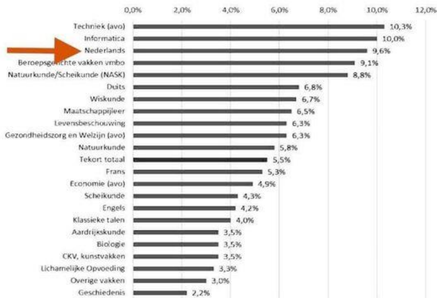
Figuur 1: Percentage tekorten leraren naar vak in het vo. Percentage van de totale werkgelegenheid per vak (OCW, 2023) 35

vacatures te vervullen, oplopend naar 665 in 2032 (zie figuur 1 hieronder). Zestien procent van alle leraren die het vak Nederlands geven, staan bovendien zonder de juiste bevoegdheid voor de klas. 34