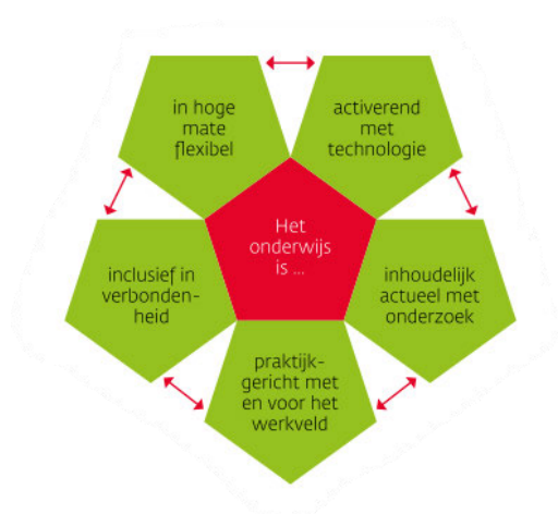
Figuur 1: visie op onderwijs (CvB, Zuyd Hogeschool, 2021)

Zuyd ambieert een onderwijsaanbod dat is afgestemd op de beroepspraktijk, op de regionale behoefte en op de diversiteit van onze instroom. Met de strategie 'Passie voor ontwikkeling' richt Zuyd zich op de succesvolle ontwikkeling van studenten tot goed opgeleide professionals en voor de regio relevante beroepskrachten. We doen dit met een goed doordacht onderwijsportfolio, dat bestaat uit een aanbod van opleidingen op verschillende niveaus in verschillende varianten en diverse vormen. Het beheer van het onderwijsportfolio vraagt permanente aandacht zodat het aanbod aansluit bij de behoeften in de arbeidsmarkt en de vraag vanuit de regio" 13 (Zuyd Hogeschool, 2023). Vanuit deze visie is de ambitie om een regionaal, breed aanbod aan opleidingen te bieden, in samenwerking met andere instellingen.