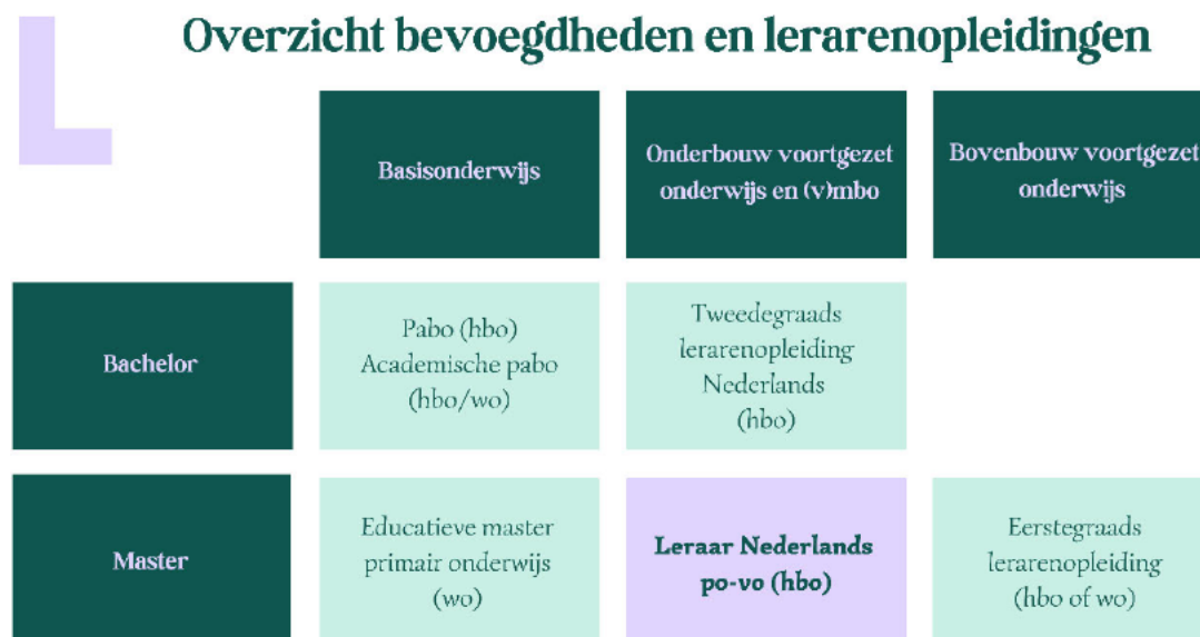
Figuur 1: Overzicht bevoegdheden en lerarenopleidingen.

Het Nederlandse aanbod van masters is volop in ontwikkeling. Het ministerie van OCW beschrijft de urgentie van meer mastergediplomeerde professionals in Nederland expliciet in haar Strategische Agenda. 22 De master Leraar Nederlands po-vo is een uitbreiding van het bestaande masteraanbod en ook een aanvulling op het bevoegdhedenstelsel. Dit is zichtbaar gemaakt in onderstaande figuur, in de middelste kolom gespecificeerd voor het schoolvak Nederlands.