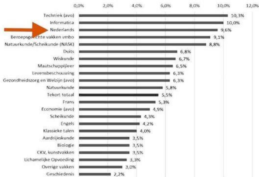
Figuur 2: Percentage tekorten leraren naar vak in het vo. Percentage van de totale werkgelegenheid per vak (OCW, 2023). 37

In de aangrenzende arbeidsmarktregio's van Leiden bestaan bovengemiddelde tekorten aan leraren Nederlands. 38 Daarbinnen is de behoefte aan tweedegraads docenten voor het vmbo/havo/vwo het grootst. Deze behoefte is aanzienlijk groter dan de behoefte aan eerstegraads docenten. 39 Het grootste tekort in de basisvakken doet zich voor bij Nederlands in het tweedegraads lesgebied. Deze behoefte aan tweedegraadsleraren is de afgelopen jaren sterk gegroeid. 40